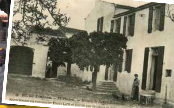
Maison des aïeules