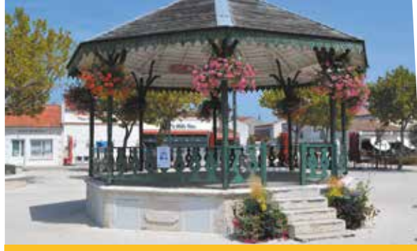
Kiosque à musique

21 œuvres d'art exposées sur des façades de la ville se dévoilent au fur et à mesure de votre déambulation dans le cœur historique de Saint-Pierre d'Oléron. Grapheurs, photographes, peintres, dessinateurs... de nombreux styles artistiques nous surprennent aux quatre coins du centre-ville. Un moyen formidable de découvrir les lieux de vie du bourg !